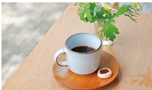
こだわりのスペシャルティコーヒー