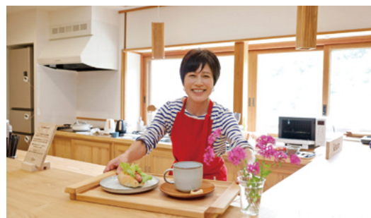
コーヒーとホットドッグのセット