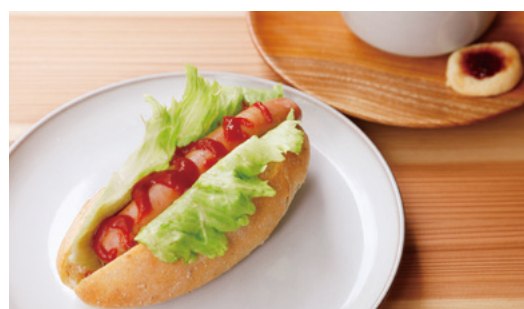
豚のホットドッグ