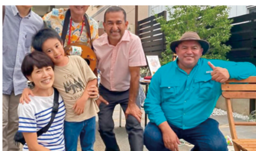
現地農園主のご家族と