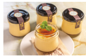
四万温泉焼きプリン