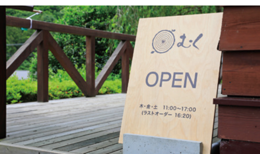
持続化を活用して作成した看板