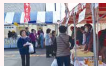
昨年度 道の駅キャラバン 道の駅 あぐりーむ昭和 (左) と道の駅 くらぶち小栗の里 (右)