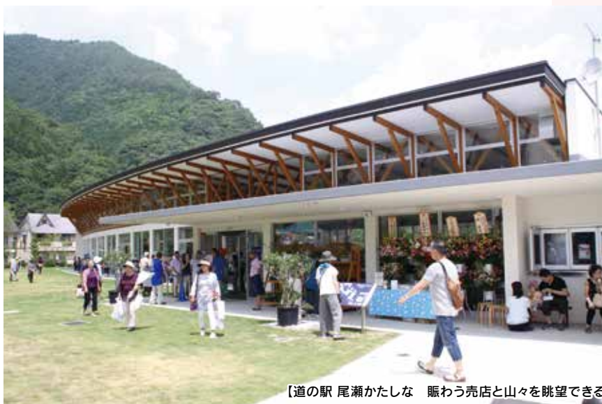
【道の駅 尾瀬かたしな 賑わう売店と山々を眺望できる足湯】