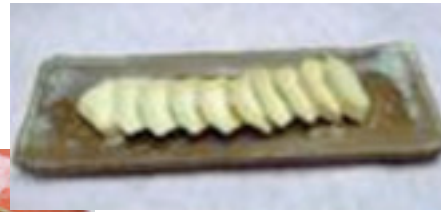
【左下：グラタン 右上：大和芋たまり漬け】