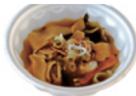
伊勢崎三色ほうとう