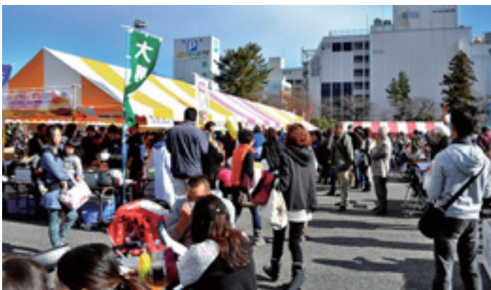
大勢の来場者で賑わった場内