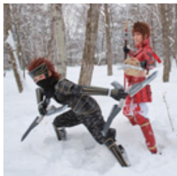
【ベルエールの森 撮影会の模様】