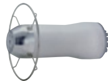
【高速回転霧化静電自動ガン】