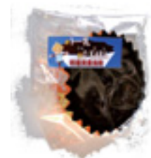
ガトーニューショカラ